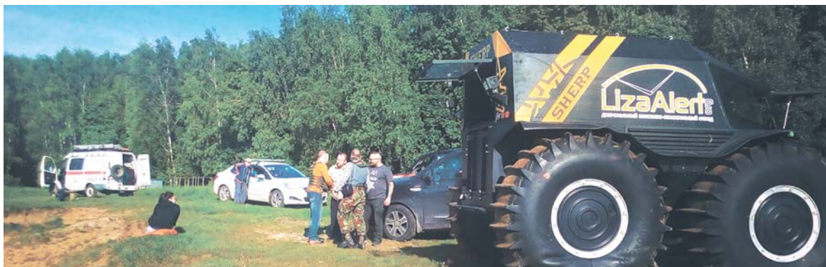
Найти и спасти потерявшегося велосипедиста удалось только к утру