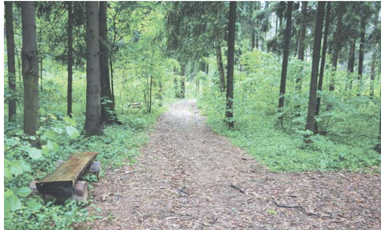
Работы по обустройству Мытищинского лесопарка уже начались

13 июня в Одинцовском районе на базе Мещерского парка состоялся семинар-совещание партии «Единая Россия». Темой мероприятия стали современные подходы в реализации задач благоустройства и озеленения городских территорий. «Создание рекреаций и зон отдыха на зеленых территориях Московской области является ключевой задачей, в каждом му-