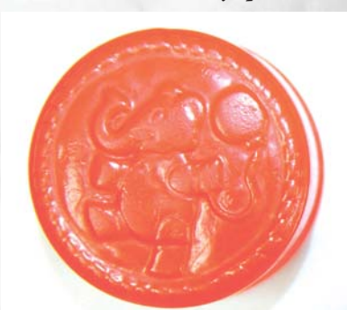
Детская погремушка времен Великой Отечественной войны