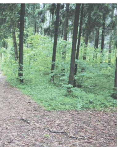
Работы по обустройству Мытищинского лесопарка уже начались

был передан в бессрочное пользование городскому округу Мытищи. Это 224 га федерального лесного фонда. На обширном участке территории вдоль Волковского и Пироговского шоссе в ближайшие годы будет реализован масштабный проект – Мытищинский лесопарк. 15 июня на его территории состоялось выездное заседание фракции партии «Единая Россия» Совета де-