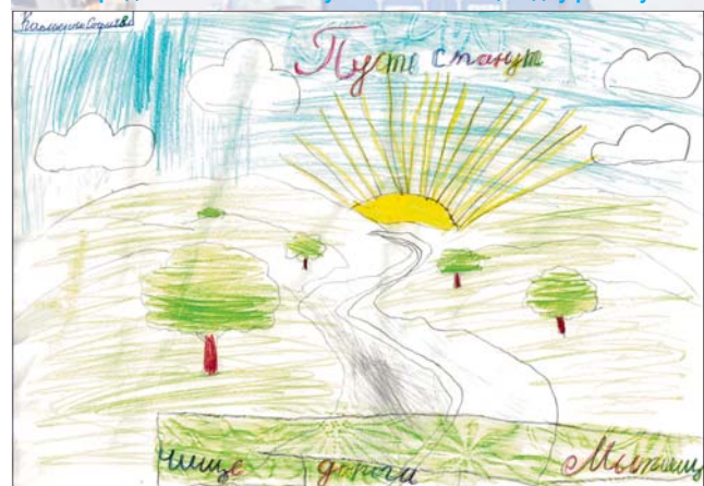
«Пусть станут чище дороги Мытищ». Каплиенко София, 8 лет