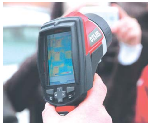
Тепловизионная съемка наглядно демонстрирует, что основные потери тепла идут через фасады домов

лежат внутри самого здания. Снижение объема потребления возможно только за счет проведения комплексных мероприятий, которые должны