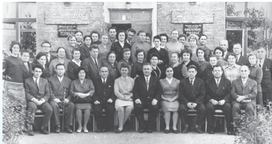
Коллектив Московского кооперативного техникума и училища МОСПО. Октябрь 1964 года

со столицей. Преимущества нового статуса были очевидны всем: московская прописка, московское снабжение, наконец, московские зарплаты.