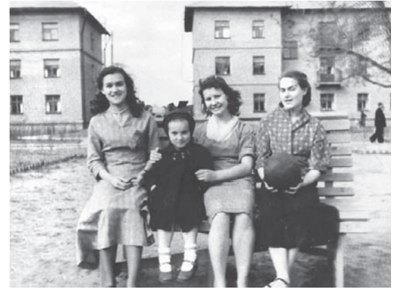
Во дворе городка Союзтеплострой («Тяп-ляп»). 1956 год

А еще через полгода завершилась эпопея с административно-территориальным переустройством.