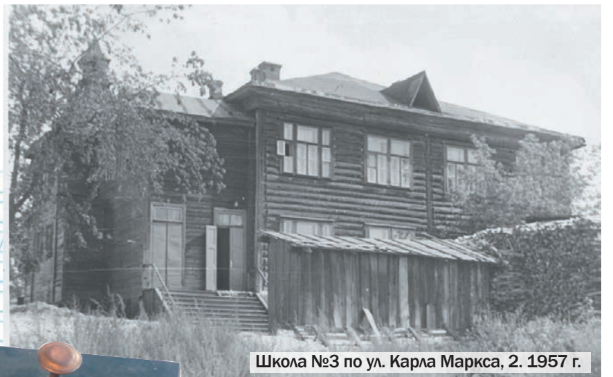
Школа №3 по ул. Карла Маркса, 2. 1957 г.