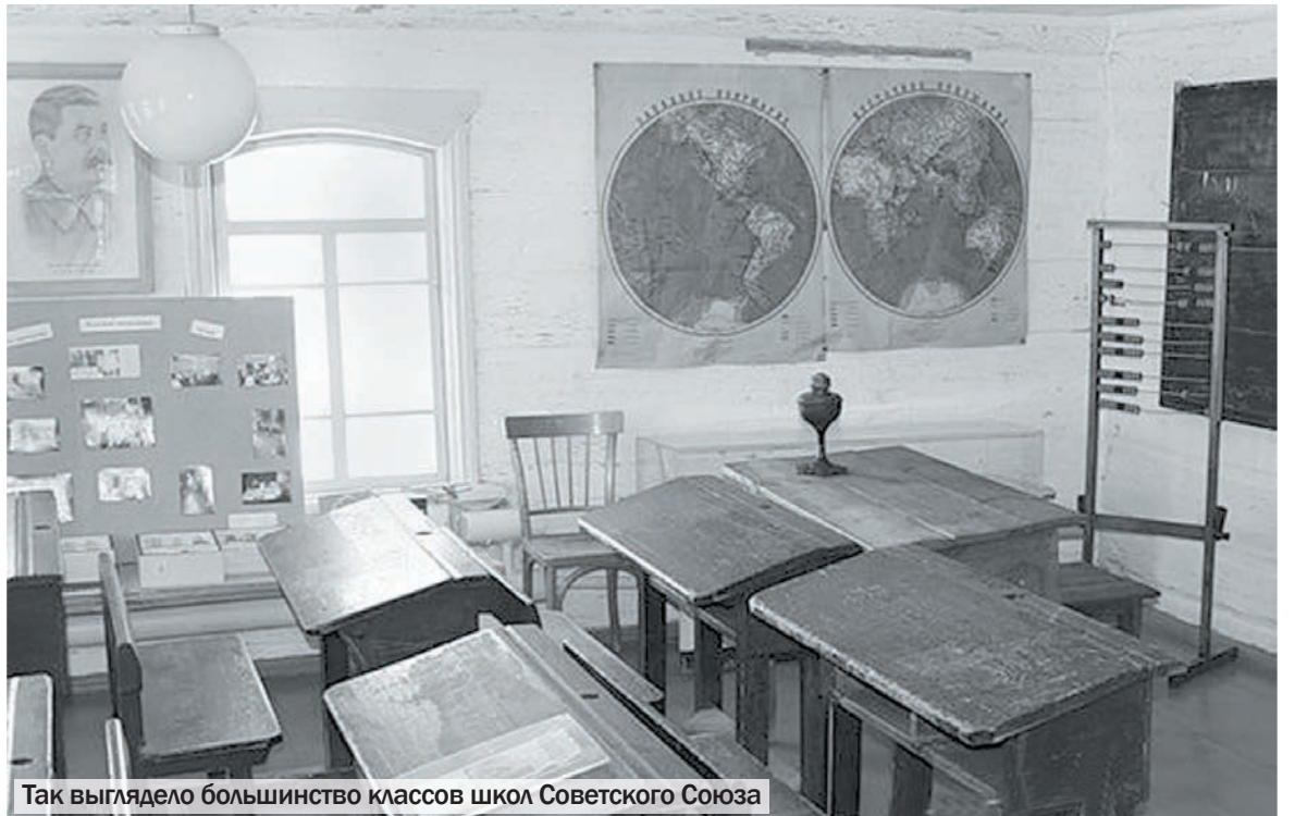
Так выглядело большинство классов школ Советского Союза

шую кучу на школьном дворе разные железки: кто тащил трубу, кто сковородку или кастрюлю. Было очень весело, соревновались, какой класс соберет больше. В новом каменном здании школы №3 был шикарный парадный вход. Справа и слева у входа в школу стояли два огромных каменных шара диаметром почти полтора метра. Слева от центральной лестницы ступеней не было, спуск был оборудован пологим подъемом. На него мы и приносили нашу «добычу» – металлолом.