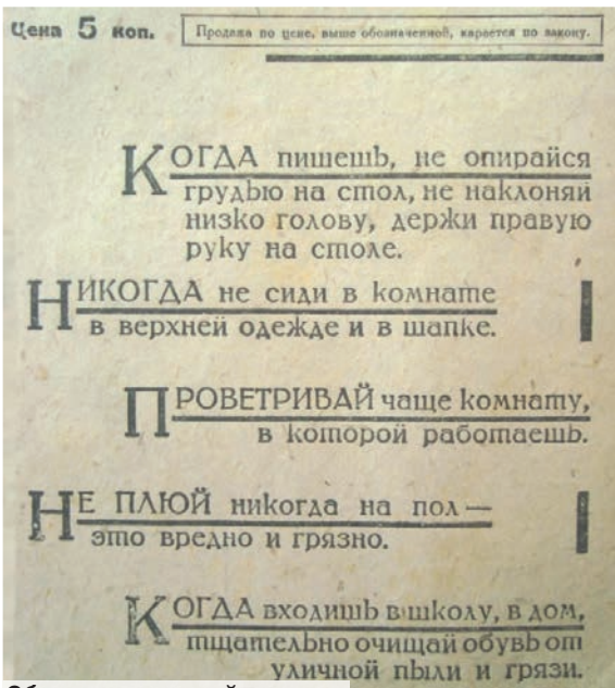
Обложка школьной тетради