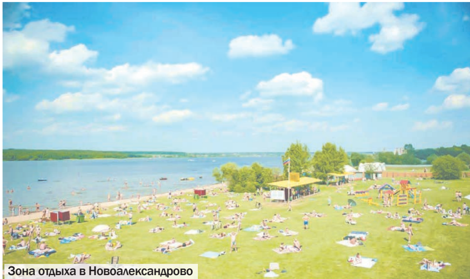
Зона отдыха в Новоалександрово