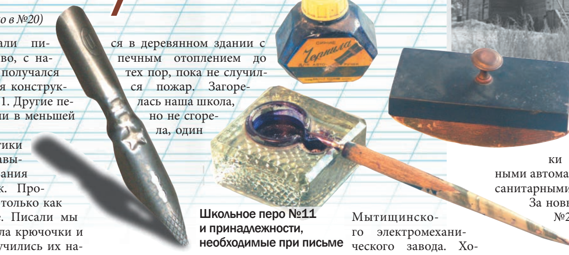
Школьное перо №11 и принадлежности, необходимые при письме