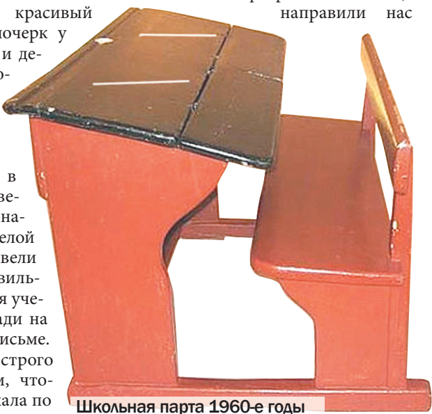
Школьная парта 1960-е годы